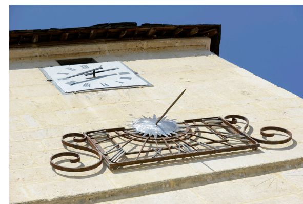
2019-08 Autour de Connelles 18