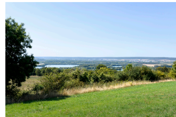
2019-08 Autour de Connelles 2

Balade dans un village en bord de Seine, où quelques curiosités vous attendent : son église, son moulin du XVe siècle dont seules les piles datent de cette époque. Ce village situé dans un vallon à flanc de coteaux a la particularité d'avoir des habitations atypiques dites troglodytes. Ses coteaux surplombant la Seine bénéficient du passage du GR 2 et sont inscrits au programme Natura 2000 et classés comme Zone Importante pour la Conservation des Oiseaux (ZICO). Ils sont propriétés pour certains du Club Alpin Français et très réputés pour leurs falaises d'escalade naturelles.