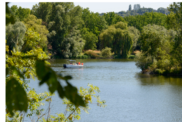
2019-08 Autour du lac de Venables 1

La Seine prend sa source à Source-Seine, en Côte-d'Or, sur le plateau de Langres et se jette dans la Manche entre Le Havre et Honfleur. Son principal affluent dans le département est l'Eure qui se jette dans la Seine à Pont de l'Arche en aval de Venables-Les Trois Lacs. C'est le quatrième plus important derrière l'Oise, la Marne et l'Yonne.