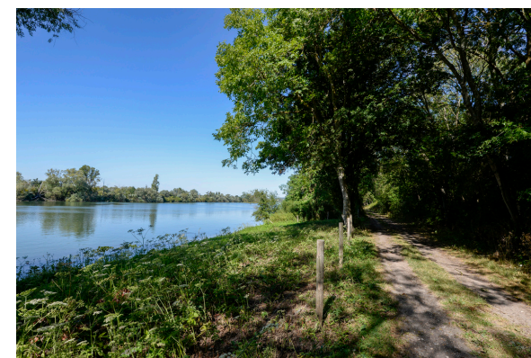
2019-08 Autour du lac de Venables 9