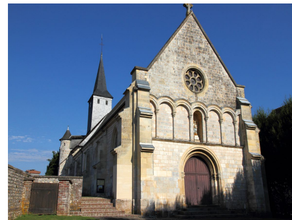
Eglise Corneville-sur-Risle

Pendant la guerre de Cent ans, les Anglais arrivèrent en vue de Pont-Audemer. Prenant peur, les moines de l'abbaye de Corneville chargèrent le trésor et les cloches dans une barque, mais le poids des cloches fit chavirer l'embarcation. Les moines récupérèrent le trésor et les cloches, sauf une. Et selon la légende, lorsque les cloches de l'Abbaye sonnèrent à nouveau, celle restée au fond de la Risle répondit au carillon de Corneville.