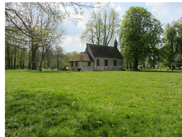
Chapelle de l'arboretum de Canaperville

L'arboretum de Canaperville Créé en 1952, il fut consacré à la plantation et à l'observation des résineux, ainsi qu'à l'implantation de feuillus exotiques dès 1960. L'arboretum s'étend sur 7,5 hectares offrant un chemin balisé de bornes explicatives pour découvrir les essences de nos régions : marro