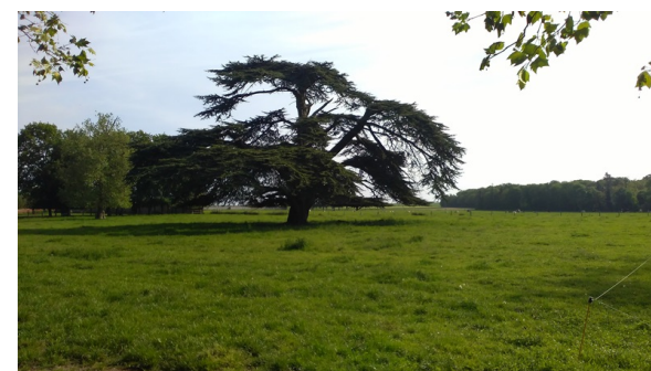
Doro 405