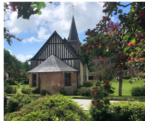
Eglise de Saint-Siméon

En France, la plupart des villes et des villages ont été bâtis le long des fleuves et des rivières. Au Moyen Age, l'église de Saint-Siméon a été bâtie dans la vallée du Sébec, assez large pour que quelques maisons soient également construites. Des activités artisanales se développent alors en prise sur la rivière : des tanneries de peau de vaches, au plus proche de l'élevage de ces animaux.