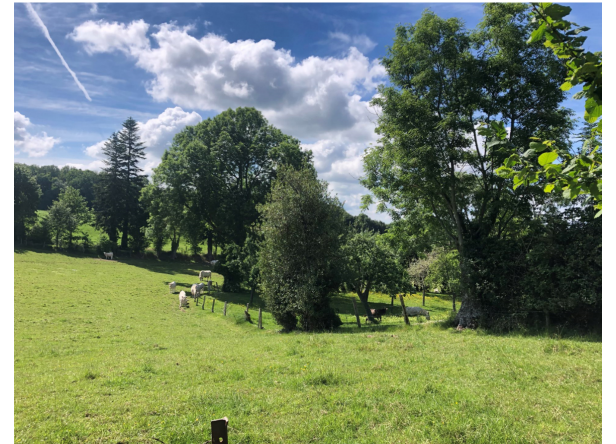
Sur le chemin des 4 gués 1