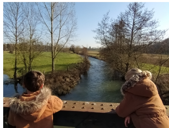
Chemin des moines2021-Vieille-Lyre

L'abbaye de Notre Dame de Lyre possédait plusieurs fermes dans la paroisse. Les moines ont probablement parcouru ce chemin pour vaquer à leurs occupations. Le logis abbatial et un mur d'enclos sont encore visibles.