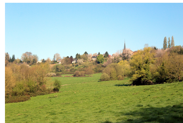
Sur le chemin des ponts et gués 3