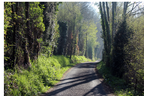
Sur le chemin des ponts et gués 2

Sur le mur extérieur sud de l'église, en silex noir incrusté dans la pierre blanche, un rébus datant du XVI e siècle semble dire : « Le monde chrétien est faucard et corrompu ». Quelle est la finalité et la motivation de cette œuvre de la Renaissance ? Qui est son commanditaire ? Le mystère plane toujours.