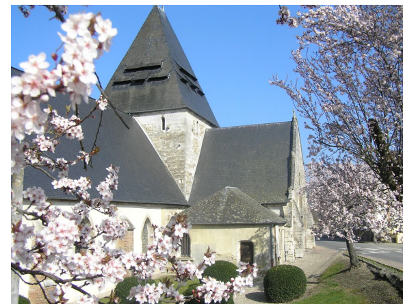
Eglise St Philbert @ ASO service patrimoine CCPAVR

Sur le mur intérieur Sud de la nef, une fresque polychrome raconte la vie de Saint-Ouen, évêque de Rouen et contemporain de Saint-Philbert. Datée du XVI e siècle et inscrite à l'Inventaire Supplémentaire des Monuments Historiques, cette fresque a été intégralement restaurée en 2000.