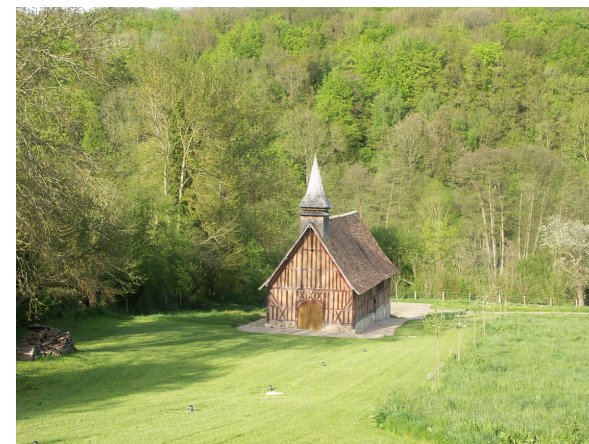
Chapelle Saint-Firmin

Inscrite à l'Inventaire Supplémentaire des Monuments Historiques, cette chapelle à colombages est unique en Normandie. Elle abritait autrefois un pèlerinage dédié à Saint Firmin réputé guérir les boiteux et les «goutteux». Aujourd'hui, elle accueille l'une des plus originales salles de réception en Normandie et peut se visiter sur rendez-vous pour les groupes. Contact : 06 88 42 65 43