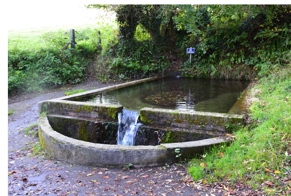
La fontaine fiacre