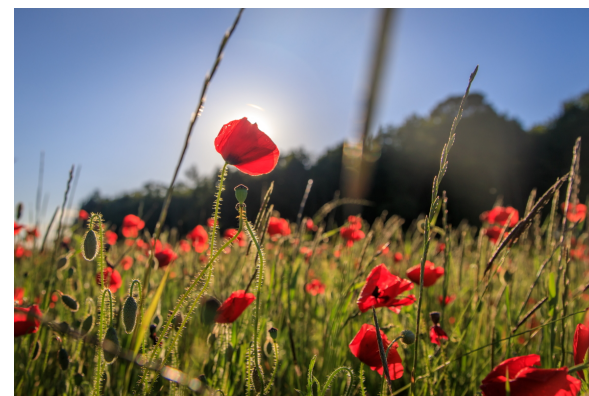
Malicorne-coquelicots 2019