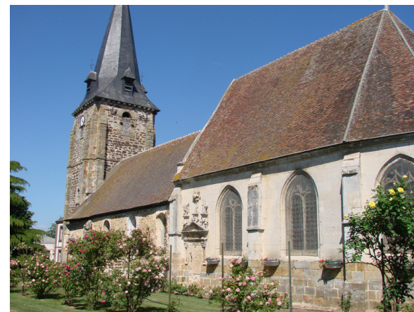
Eglise de Francheville

De par sa situation idéale - le long de l'Iton, en bordure de forêt, et basé sur un sol riche en minerai de fer - Francheville a vécu du travail du fer pendant des siècles. En 1914, on comptait encore 400 forges pour 1 800 habitants, toutes spécialisées dans la bourrellerie (harnachement des chevaux). Un attachant musée retrace cette histoire.