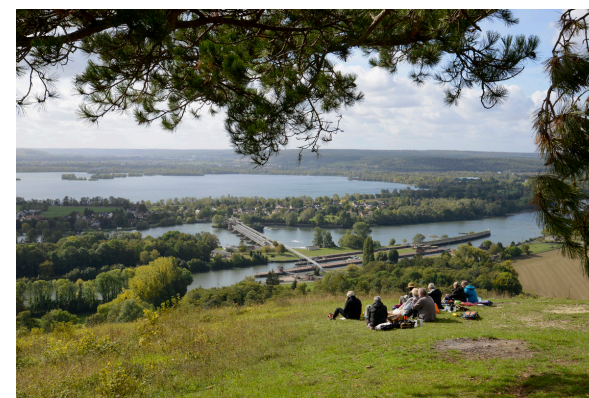
2019-08_Randonnée Cote des 2 amants 12