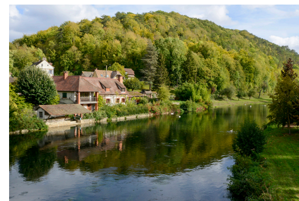
2019-08_Le bois Ricard à Acquigny 6