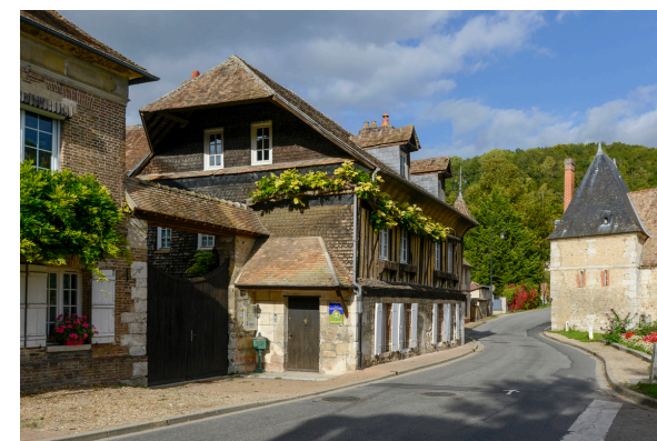
2019-08_Le bois Ricard à Acquigny 5

La Légende des Saint Martyrs d'Acquigny Au début du 5e siècle, l'évêque Mause s'était réfugié en Gaule avec son frère Vénérand. Pourchassés par le proconsul, ils furent rejoint au lieu-dit « Clos Saint-Mause » où ils subirent le martyr et eurent la tête tranchée. Leurs têtes sont conservées dans une châsse reliquaire qui se trouve dans la salle des archives de la mairie d'Acquigny.