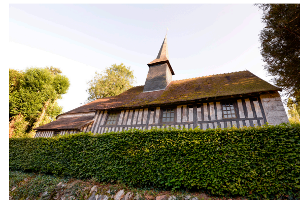
2019-08_Sentiers du Due 3

A Saint-Germain-de-Pasquier, se trouve la chapelle et la source Sainte Clothilde. Selon la légende, cette source guérit toutes sortes de maux. Jadis un pèlerinage avait même lieu au mois juin. La chapelle abrite aujourd'hui la mairie du village. Elle est célèbre pour être la plus petite mairie de France !