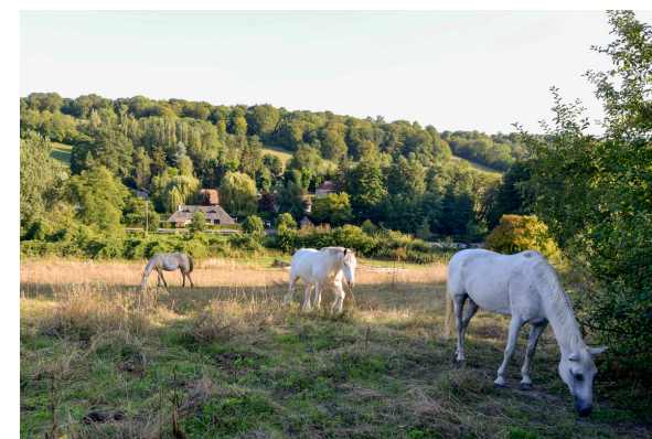
2019-08_Sentiers du Due 6