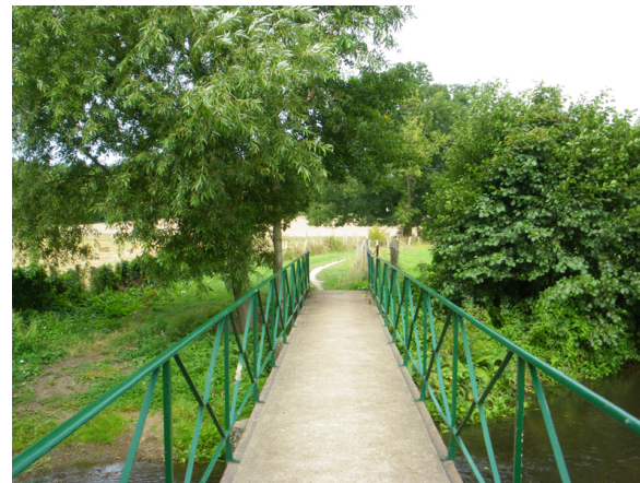
Iton_la_forge (2)

Bourth a depuis très longtemps eu une tradition industrielle, comme en témoignent la grosse forge de Bourth et le haut fourneau. Cette forge fut installée vers 1640 par la famille Leveueur de Tillières au bord de l'Iton pour utiliser sa force motrice hydraulique.