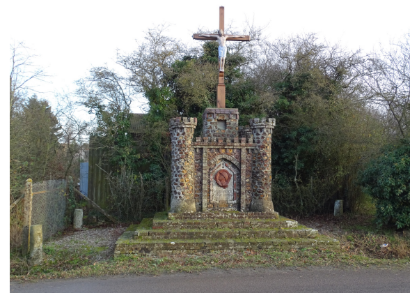
PR la belle au bois normand - calvaire

Bois-Normand, site féodal primitif : c'est aujourd'hui le château près de l'église, Rouge Maison, Chavanne et La Duquerie.