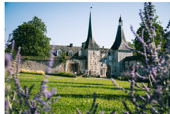
Aurelien Papa, Département de l'Eure

Un problème à signaler sur l'itinéraire (problème de balisage, pollution, etc.) ? Rendez-vous sur le site et/ou l'application SURICATE pour localiser et signaler.