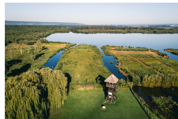
Fred Grimaud, Département de l'Eure