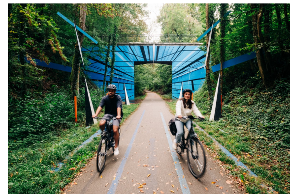
Captain Yvon - Hom project

La Vallée de la Charentonne est une escapade cycliste incontournable. Ce parcours de 37 km, aménagé sur une ancienne voie ferrée, offre un itinéraire à faible dénivelé. En pédalant le long des berges de la Charentonne, vous découvrirez des paysages bucoliques, des sous-bois ombragés et des villages typiques aux maisons à pans de bois. À Bernay, explorez son riche patrimoine, notamment l'Abbatiale Notre-Dame. À Broglie, profitez des aires de pique-nique et des jeux pour enfants. Le parcours est également ponctué d'œuvres d'art urbain, ajoutant une touche moderne à ce cadre naturel. Cet itinéraire est idéal pour une sortie alliant nature, histoire et créativité.