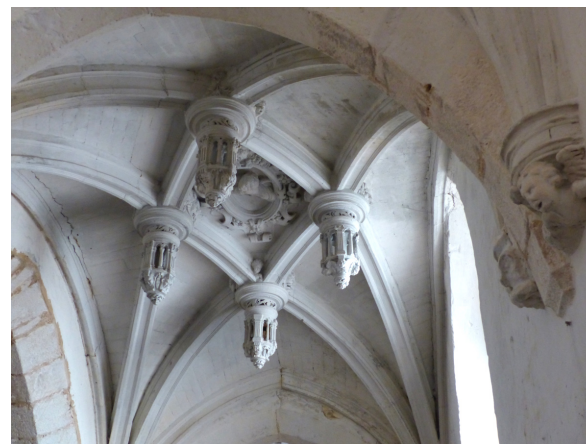
Les Bois Francs-Pullay