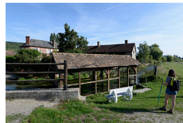
2019-08_Les sentiers de l'Iton 7