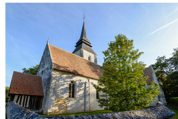
2019-08_Les sentiers de l'Iton 1

Le bras naturel de l'Iton, quant à lui, se jette au sud du village à côté de l'étang, en face du lieu-dit du « Clos St Mauxe ». L'Iton fut aussi