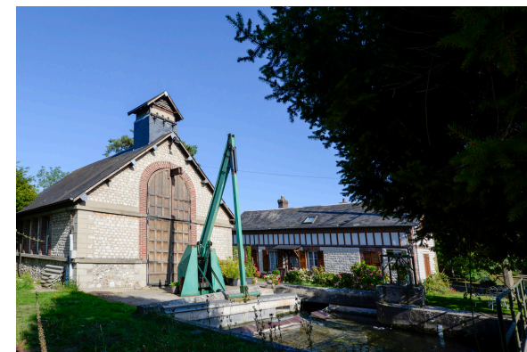
2019-08_Les sentiers de Val de Reuil 7

Cette balade vous propose un panel de paysages du pays Seine-Eure. Autour de la cité contemporaine vous rencontrerez plusieurs traces du passé. En bordure de l'Eure découvrez une ancienne écluse ou encore une église bâtie il y a plusieurs siècles qui comprend de nombreuses références de l'époque de la navigation sur l'Eure. Du côté de la forêt domaniale de Bord-Louviers, vous emprunterez des chemins forestiers au cœur de 4 500 ha de feuillus et de résineux.