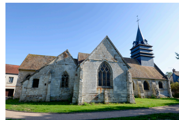
2019-08_Les sentiers de Val de Reuil 11