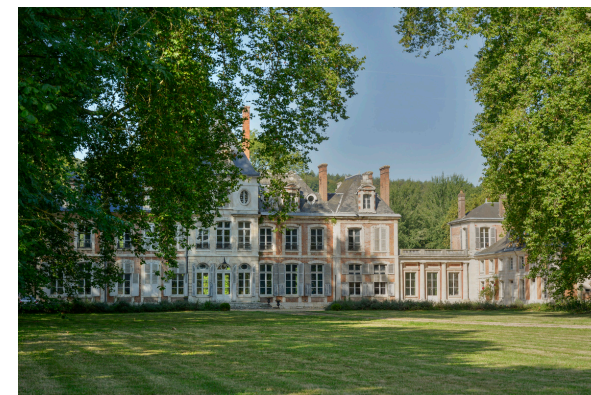
2019-08_Pinterville Histoire et Nature 39

Cette promenade vous révèle un charmant village au caractère champêtre, son église, son château et ses coquettes demeures. Partez à la découverte de ses plaines, coteaux et forêts qui vous enchanteront, tout en photographiant la faune et le flore des sous-bois et la multitude de variétés d'orchidées sauvages; nichées dans les fossés en bordure de forêt.