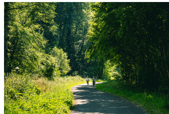
Département de l'Eure Aurelien Papa