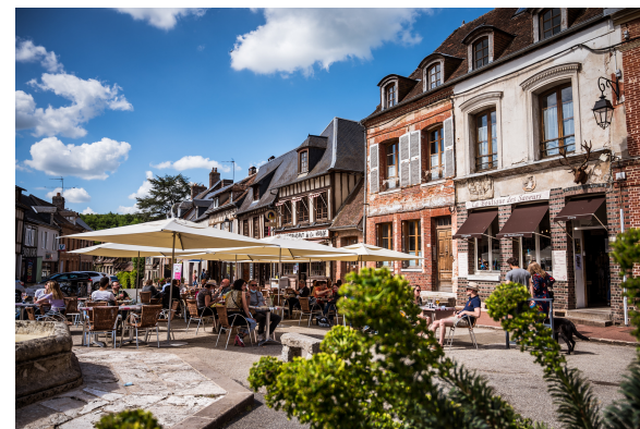
Département de l'Eure Aurelien Papa